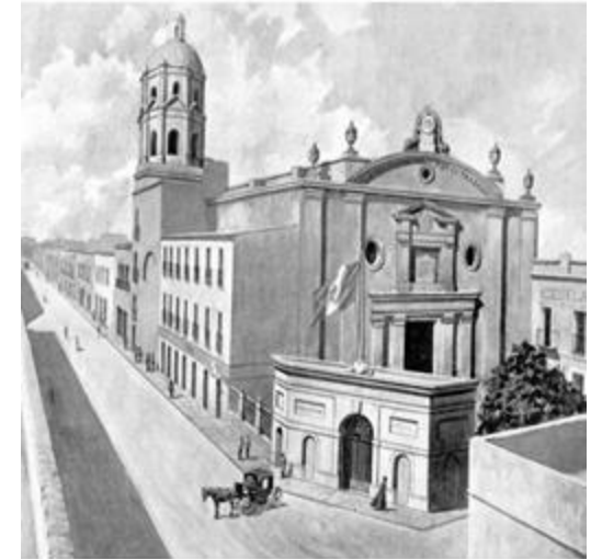
Colegio de San Pedro y San Pablo