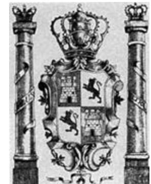
Escudo de la Real y Pontificia Universidad de México

Consulta tu libro de texto gratuito en el tema " La Conquista espiritual ".