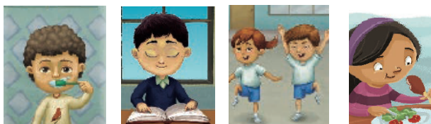
SEP (2018). pp.54-57 Conocimiento del medio. Primer Grado.