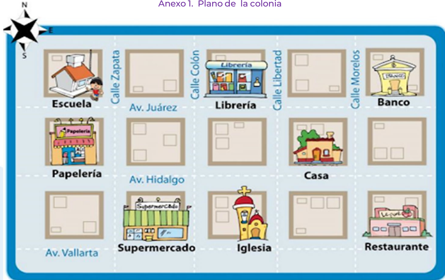
Anexo 1. Plano de la colonia

Describir rutas y ubicar lugares utilizando sistemas de referencia convencionales que aparecen en planos o mapas