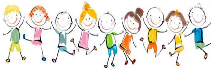
Imagen niños brincando https://static5.depositphotos.com/1001976/452/v/450/depositphotos_4522295-stock-illustration-happy-kids-playing.jpg

Puedes aprender a comparar números observando el Video 2, el cual tiene su liga electrónica abajo.