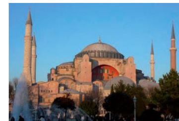
Catedral de Santa Sofía, construida en cinco años (532-537). Se localiza en lo que hoy es Estambul, Turquía.