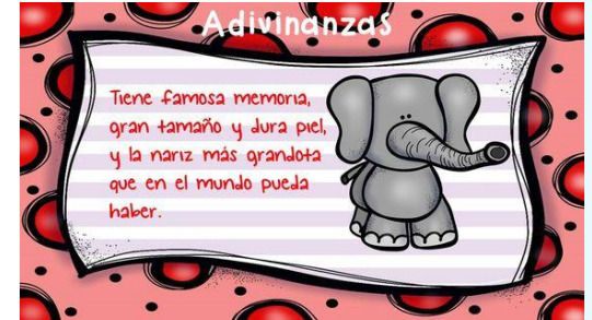
Orientación Andújar. Adivinanzas divertidas de animales para niños.