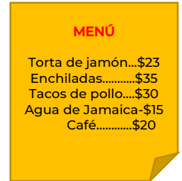
Elaborada por la Coordinación Sectorial de Educación Primaria (2020).