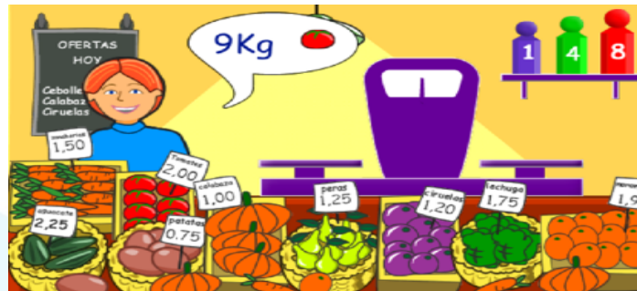
Imagen de la tiendita

Si no puedes acceder a la liga, entonces, ponte de acuerdo con tu familia para que jueguen a la tiendita utilizando juguetes u otros objetos que te presten. Recuerda ponerle precio a cada objeto, y hacer tu dinero con papel, para que puedas pagar sin problema.