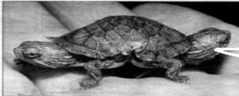
Muchos quieren comprar el exótico reptil.

Jay Jacoby, encargado del área de reptiles exóticos del Big A's Aquarium Supercenter explicó que las cabezas operan independientemente, que se alimentan en forma normal y que sólo a veces intentan caminar en distin-