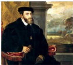
Rey Carlos I de España.

Tanto Hernán Cortés, La Real Audiencia y el Virrey, estaban totalmente subordinados al monarca español, si bien la Nueva España tenía una organización política que permitía la gobernabilidad del territorio, ésta no era independiente.